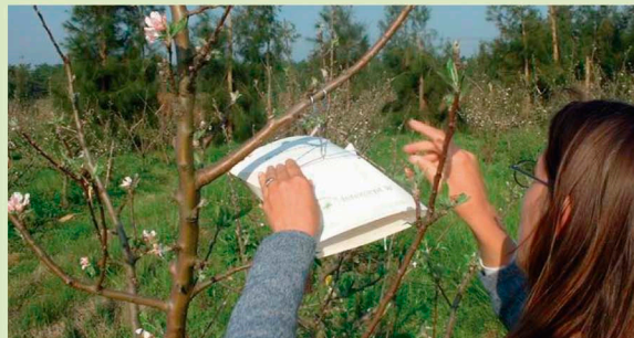
Técnicos con tampa instalada

Para la vigilancia de esta plaga se realizan actividades de exploración y establecimiento de rutas de trapeo, distribuidos en plantaciones comerciales y en puntos de riesgo